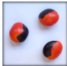
Olho de cabra