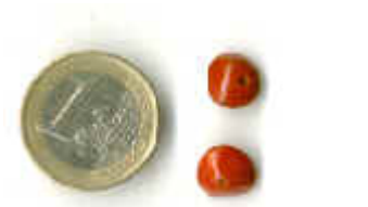
Semente de Sibipiruna