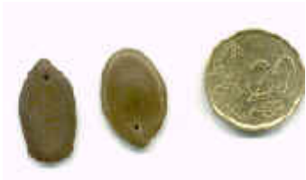
Semente de Guapuruvu