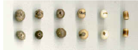
Semente de Açaí