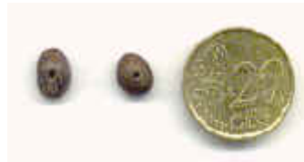
Prego de gato