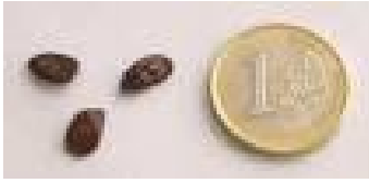
Semente de Acácia