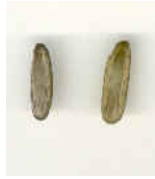
Semente de Flamboyant