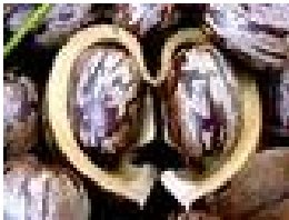
Semente de Seringueira