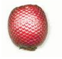
Semente de Buriti