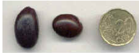
Semente de Jatobá