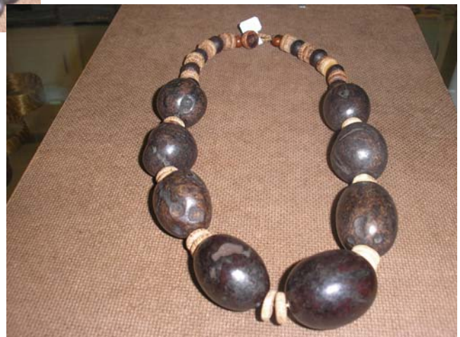
Olho de boi