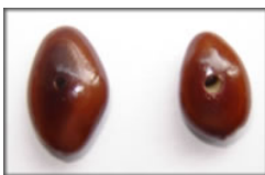
Semente de cafezinho