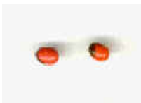
Olho de pomba