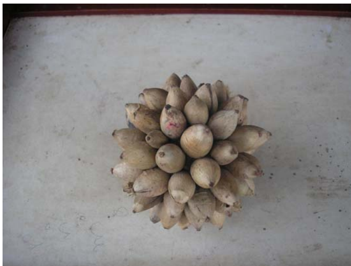
Bola de Coquinho Jerivá