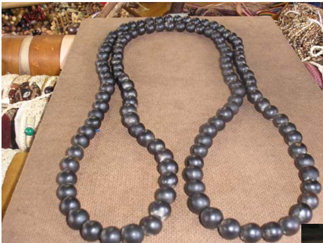
Semente de saboneteira

Com relação às sementes do cerrado, não existe dificuldade na obtenção da matéria-prima ou mesmo da qualidade ideal das mesmas para que possa ser processada. Não existe local certo para coleta, mas o volume é suficiente. Os artesãos coletam gratuitamente as sementes, recebem doações de amigos, vizinhos, ou mesmo de outros. Em alguns casos, raros, as sementes são compradas por algumas lojas que depois as transformam em obras de arte.