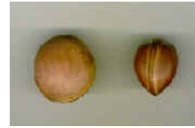
Olho de boi